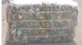
軟プラ（梱包後包装）